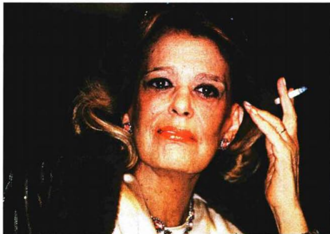
Melina Mercouri, grčka ministrica kulture iz osamdesetih, koja je osmislila ideju europskih glavnih gradova kulture

Samo dva grada imaju kakvu takvu priliku da se realiziraju kao nekakve prijestolnice kulture. Zagreb koji ima infrastrukturu i Rijeka koja ima europski duh